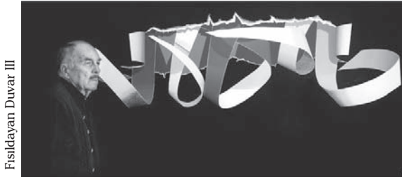
Fısıldayan Duvar III

“Haber”, “sanat çevreleri”ne “bomba gibi” düştü. “Türk çağdaş resmi”nin “yaşayan” ressamı Burhan Doğançay’ın “Mavi Senfoni” adını verdiği “tablo”su, 2,2 milyon TL’ye satıldı.