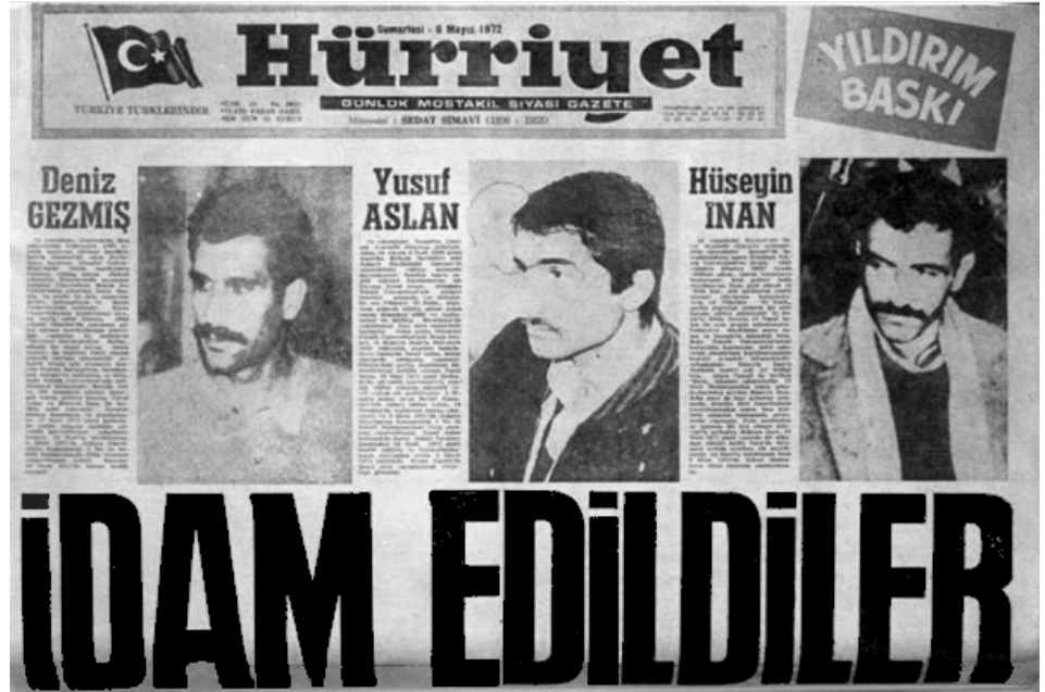
DENİZ GEZMİŞ YUSUF ASLAN HÜSEYİN İNAN 6 Mayıs 1972 / Ankara